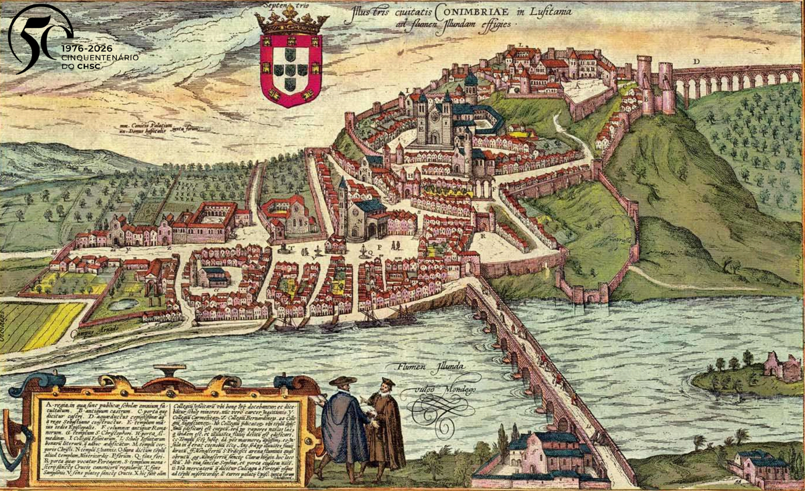
Vista de Coimbra no século XVI, publicada por Georg Braun em Civitates orbis terrarum. 1598

Septem, trio Illus tris civitatis CONIMBRIAE in Lusitania ad flumen Ilundam effigies.