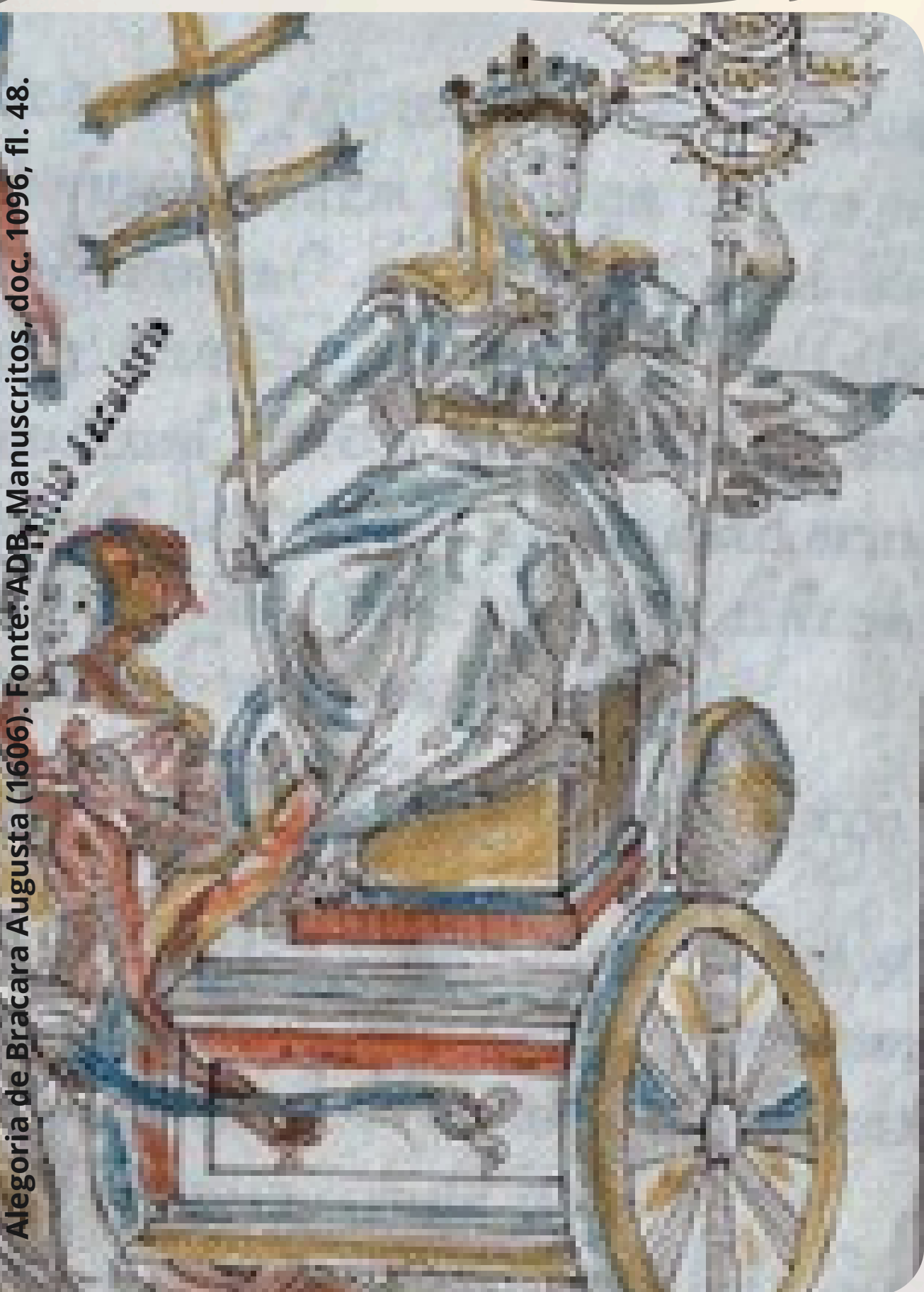
Alegoria de Bracara Augusta (1606).